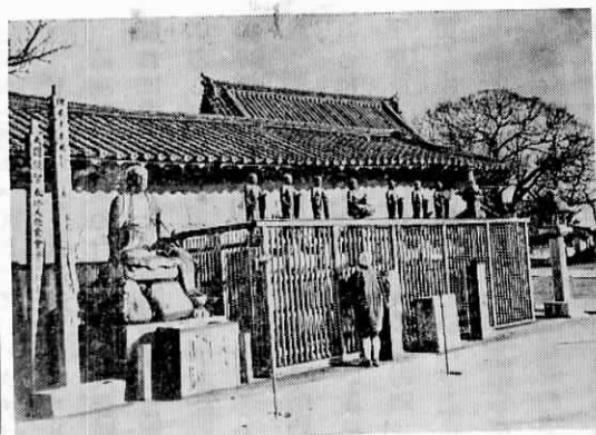
千日山安楽寺西の坊のヘイに沿って立っていた六地藏尊。いまの「ときわガンコーナー」「千日会館」あたり