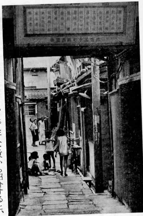
和助や留吉が飛び出してきそうな西賑町の「ろうじ長屋」

まん中は、三十そこそこで独身の辻八卦・宮崎八十八（やそはち）先生。昼は天満天神の境内、夜は三日の日なら老松町、一、六なら御霊はん、八の日なら稻荷山と、緑日の夜店を選んで見台を出している。「運氣縁談・走り人・失せもの判断」と声ひくく呼びかけ、日月・算木の絵を書いた行燈もわ