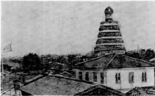
(上) 「ミナミの五階、眺望閣と (下) 「キタの九階、凌雲閣。