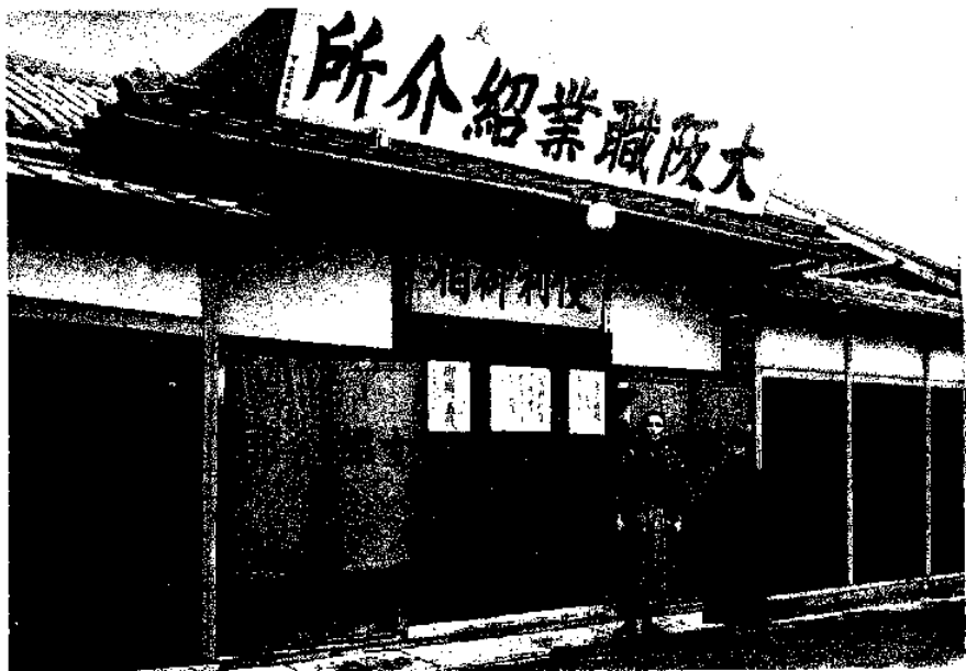
創業者時代の大阪職業紹介所