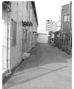
おく ほそなが たてもの 奥に細長い建物