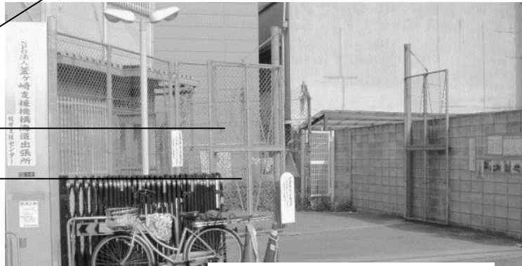
▲「禁酒の館」正面入り