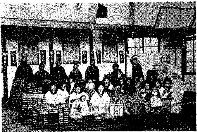
(大阪自賑館授産場)

に關與するもの、等しく經驗する共通の悩みであつて其の完璧を誇り得るもの寡聞にして未だ之れを知らぬ、我れ等亦聊か驥尾に附して妥當適法の對策を研鑽講究すと雖も常に種々なる障礙に遮られて具體案の發見に焦慮するもの、願はくは徹底せる社會政策の進展と産業政策の合理的發達によつて失業防止策の確立を要望し更らに進んではニユージランドのその様の様に失業徒食者の影を絶つ時の來らん事を祈念して息まぬ次第である。