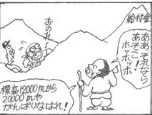
▲西成労働福祉センター センターだより 第 408 号掲載

がつ にち あさ ひ しんぶんちようかん きゅう ふ きん し きゅうおく おおさかし しや 6月5日の朝日新聞 朝刊に、「給付金支給遅れ/大阪市が謝 ざい たいはんこんげつちゅうふり こ きじ 罪/大半今月中振込み」の記事がありました。