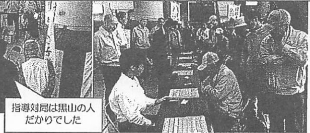
指導対局は黒山の人ばかりでした