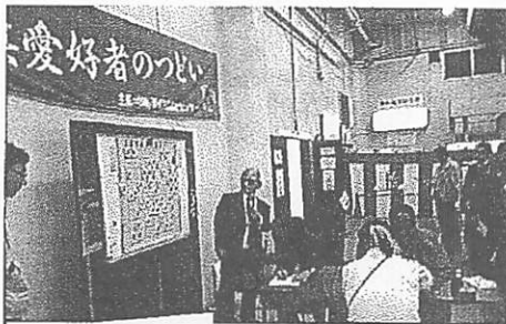
席上対局や詰将棋では、大盤を使って森先生に解説していただきました