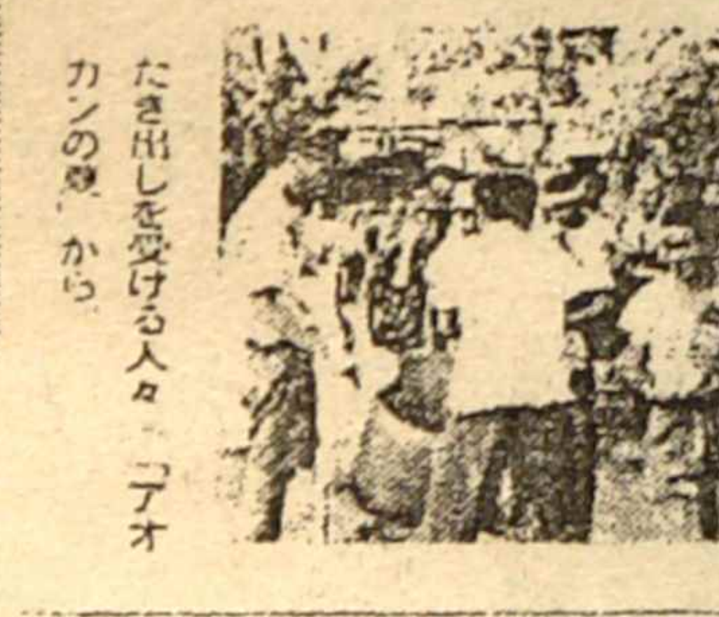
「アオカンの夏」の取材風景