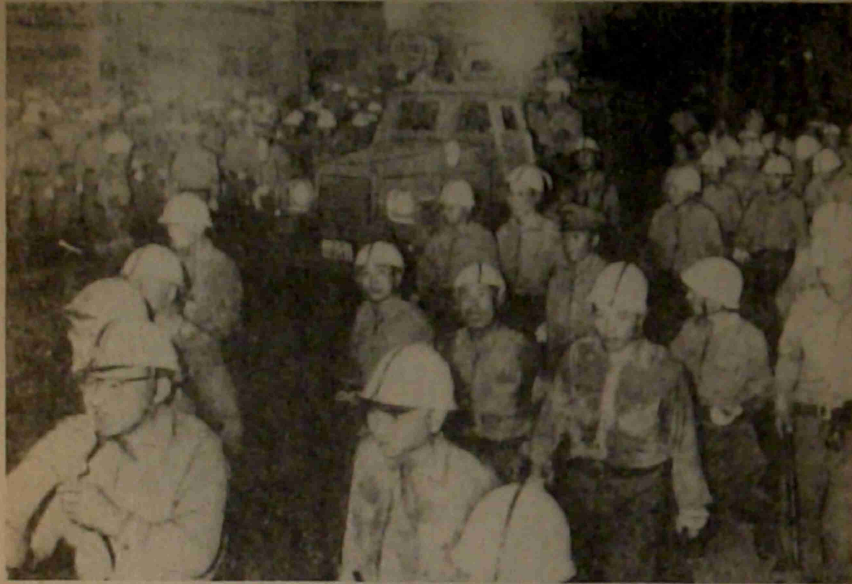
装甲車を中心に 群衆に解散を呼びかける警官隊 (西成署付近で3日午後10時ごろ)