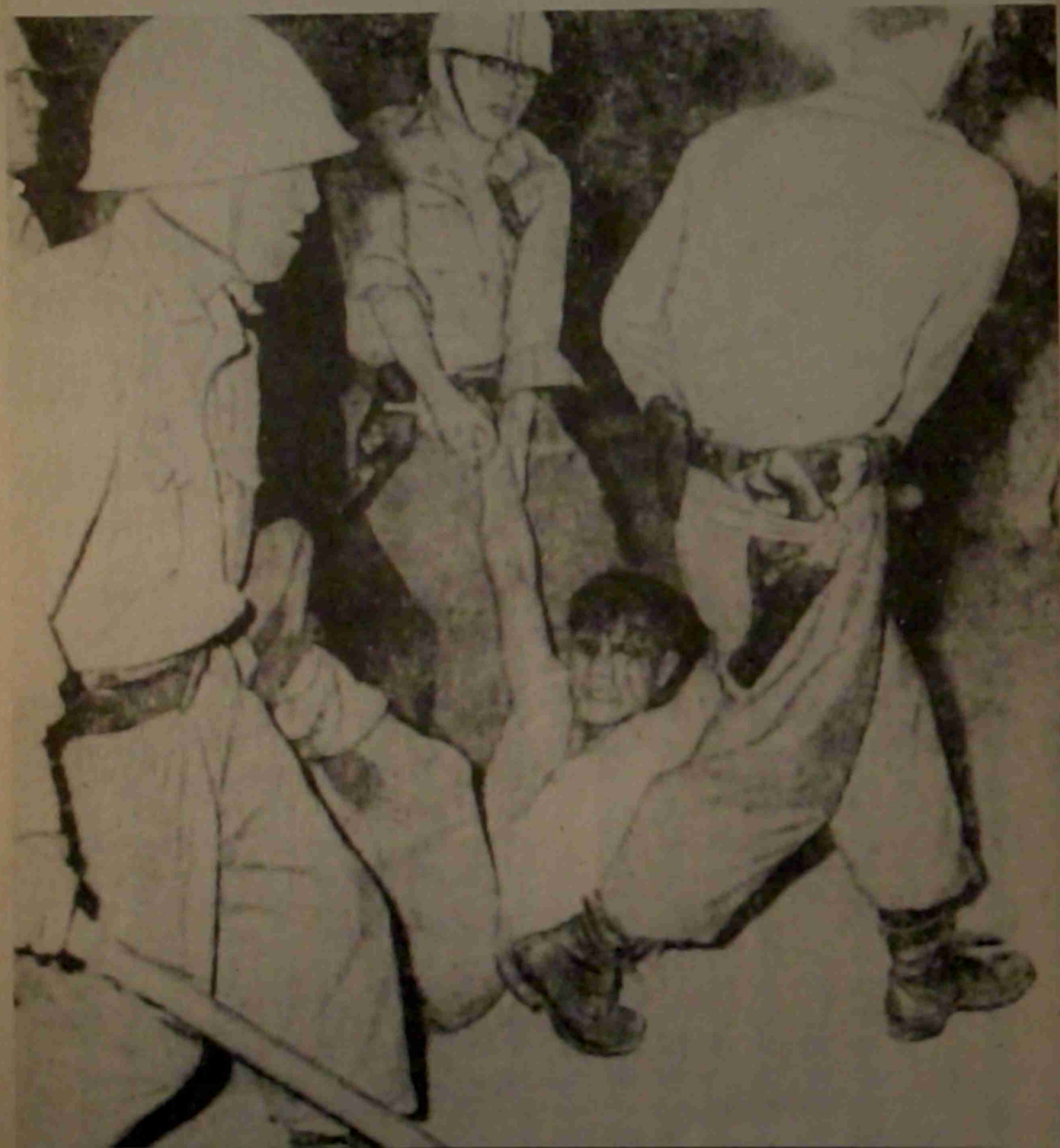
頭から血を流して連行される暴徒 （西成署北方100メートルの道路上で3日午後8時15分写す）朝日4日朝刊